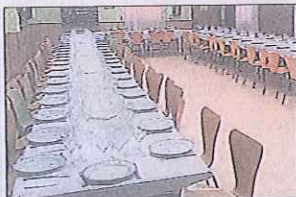
Comedor de la Escuela.

El Castillo de Coca es el eje central de la Escuela de Capataces Forestales, en el que se ubican las zonas docentes y el internado. Además, el centro cuenta con otras dependencias en las que se imparte la formación práctica. Por un lado, está la 'antigua papelera', donde se ubican las aulas de prácticas, las naves donde se guarda la maquinaria y las aulas de mecanización y talleres. El 'vivero del río' tiene una superficie de más de una hectá-