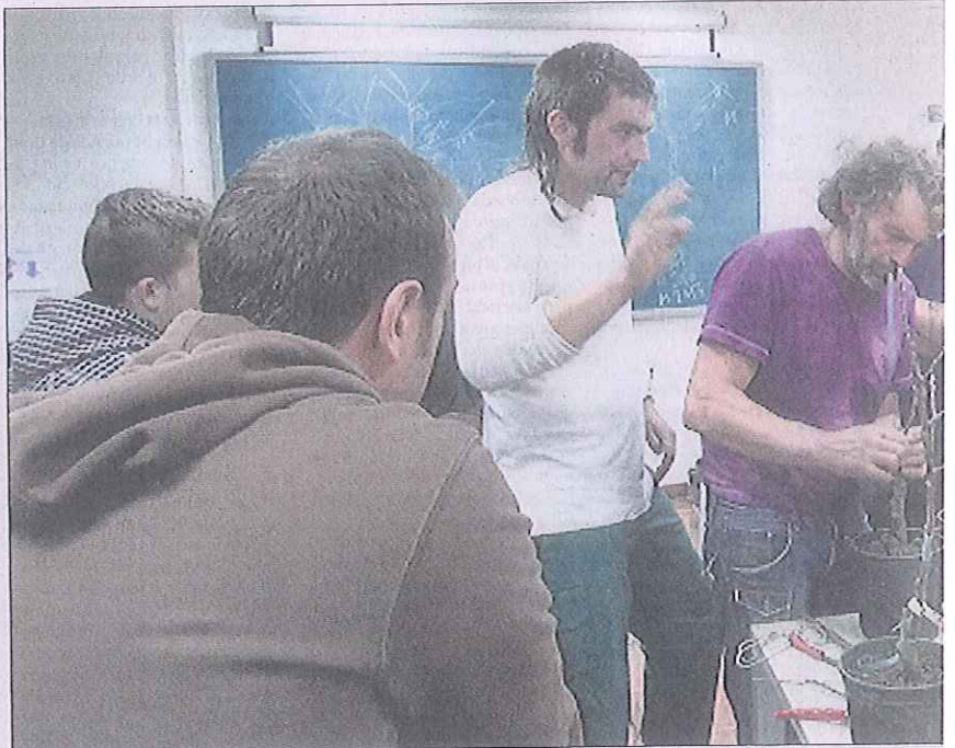
La Escuela de Coca cuenta con dos viveros, de una hectárea y una y media, respectivamente, en el que los alumnos realizan sus prácticas

La Escuela de Capataces Forestales de Coca, dependiente de la Consejería de Agricultura y Ganadería de la Junta de Castilla y León, imparte dos ciclos de formación forestal: técnico en aprovechamiento y conservación del medio natural y técnico superior en gestión forestal y del medio natural.