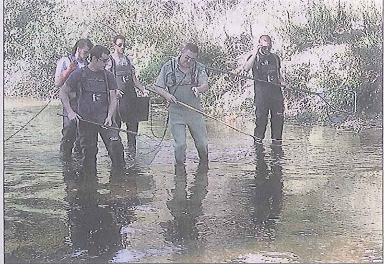
Los alumnos también aprenden otras prácticas relacionadas con el medio, como la pesca.