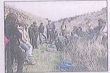
Los alumnos realizan muchas clases prácticas.

▶ Junto a los centros de formación de capataces del sector de Almazán (Soria) y Almazcara (León) es el único que oferta los dos ciclos de forestales en Castilla y León ▶ Uno de los grandes atractivos de la Escuela caucense es que se ubica en el castillo mudéjar de la villa segoviana y dispone además de un internado de 60 plazas