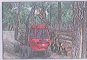
Prácticas de silvicultura. / EL ADELANTADO

El Castillo de Coca es el eje central de la Escuela de Capataces Forestales, en el que se ubican las zonas docentes y el internado. Además, el centro cuenta con otras dependencias en las que se imparte la formación práctica. Por un lado, está la 'antigua papelera', donde se ubican las aulas de prácticas, las naves donde se guarda la maquinaria y las aulas de mecanización y talleres. El 'vivero del río' tiene una superficie de más de una hectá-